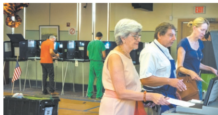
En Miami-Dade hay más de un millón de residentes inscritos para votar.

En Miami-Dade, además de votar en las elecciones de medio mandato el 6 de noviembre, responderemos sí o no a una serie de importantes medidas que ▶ PASE A PÁG. 4A