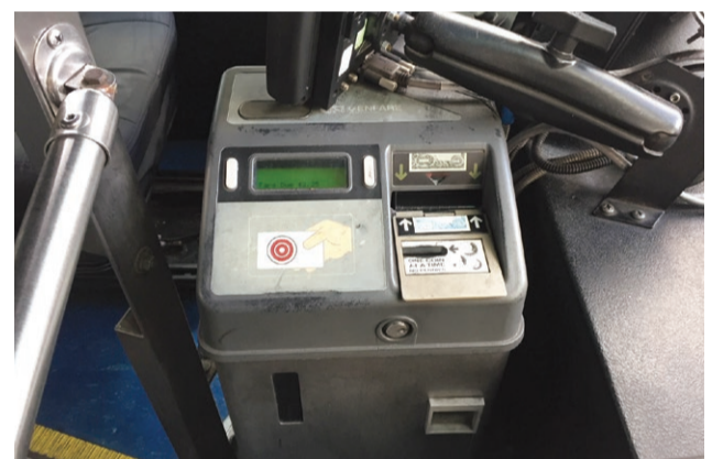
Una máquina de cobro de pasaje en los ómnibus.