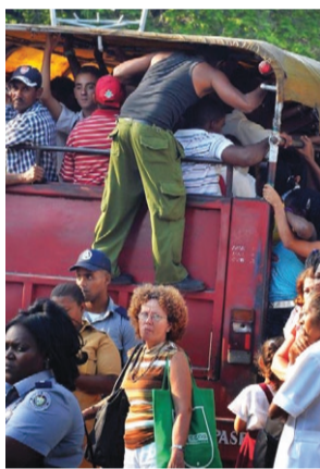
Abordar cualquier tipo de transporte conlleva disímiles peligros.